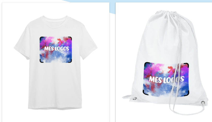
Exemples d'articles à personnaliser non-contractuels.